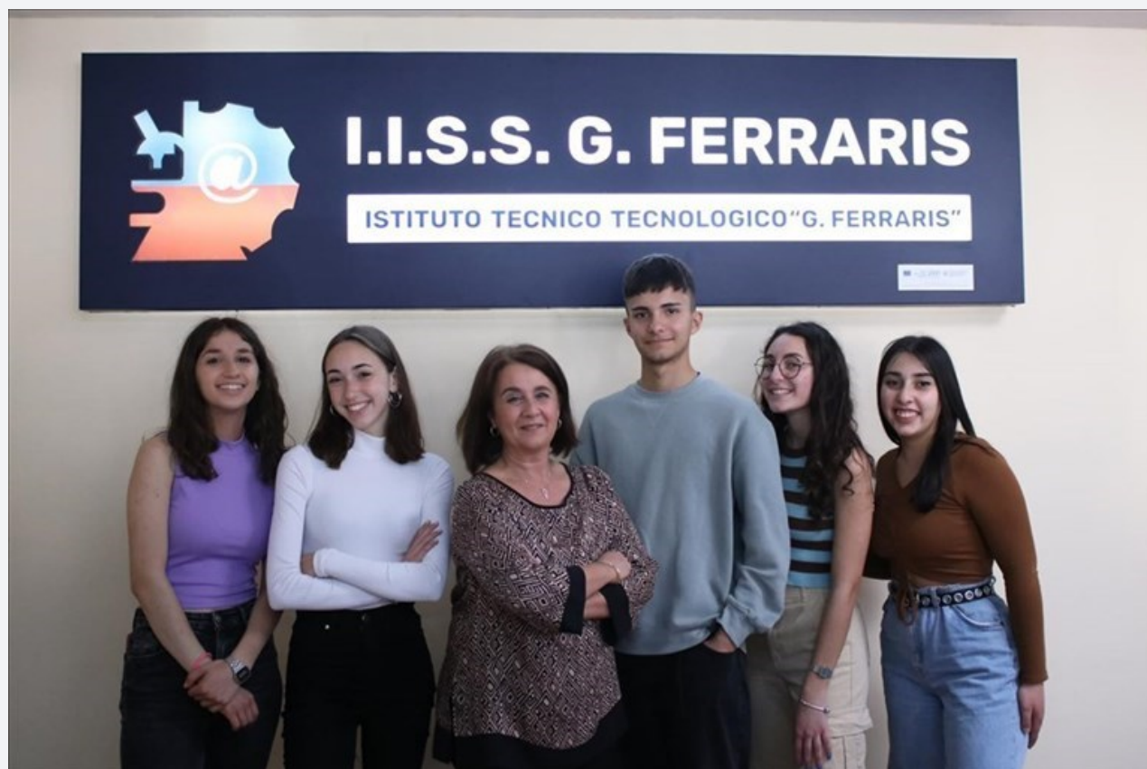
IISS Galileo Ferraris

OGGI LA FINALE NAZIONALE DELLA CHALLENGE 2022. L'ISS "FERRARIS" RAPPRESENTA LA PUGLIA