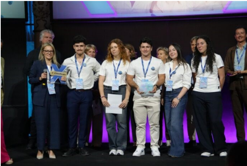
Mad for Science - i ragazzi del Vian

Il terzo posto conquistato dal Liceo Scientifico Ignazio Vian di Bracciano, sede di Anguillara Sabazia, alla decima edizione di "Mad for Science" rappresenta molto più di un risultato prestigioso, è la conferma di un percorso educativo che mette al centro la curiosità, la ricerca e la capacità dei giovani di immaginare soluzioni nuove per le sfide del futuro. Il progetto "Medical Fish Waste", premiato con 30.000 euro destinati al potenziamento del laboratorio di scienze, testimonia la maturità scientifica e la creatività degli studenti, capaci di confrontarsi con i migliori istituti italiani su un tema complesso e attuale come quello delle biotecnologie applicate alla tutela delle risorse naturali e della salute.